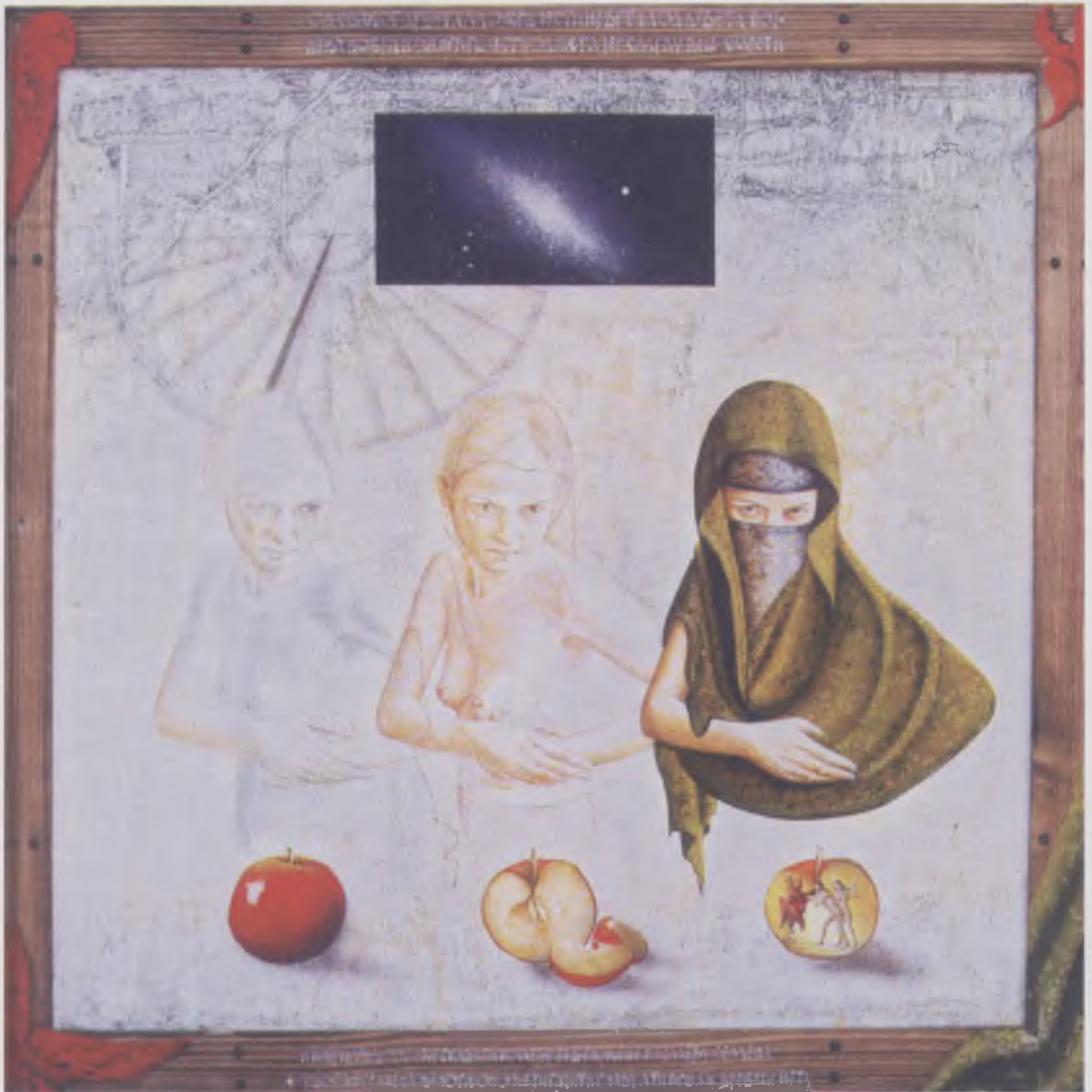
Tajna , akril na platnu, 80x80cm, 2011.