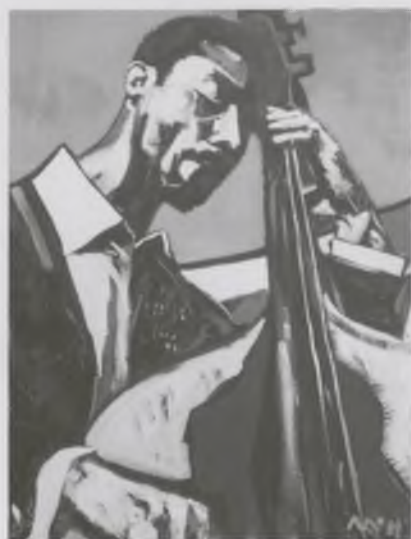
Love my contrabass