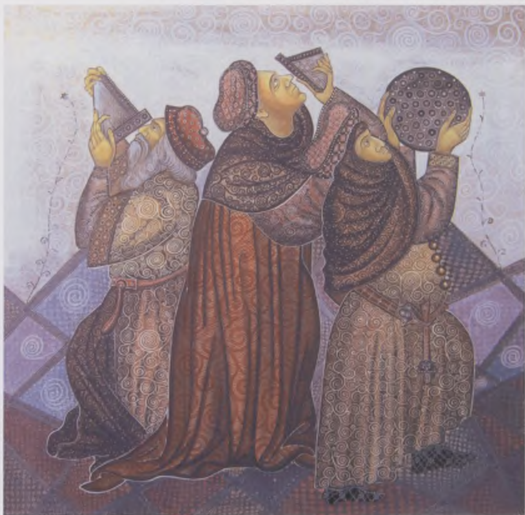
Skupljači zvezda, akril na platnu, 80x80cm, 2011.