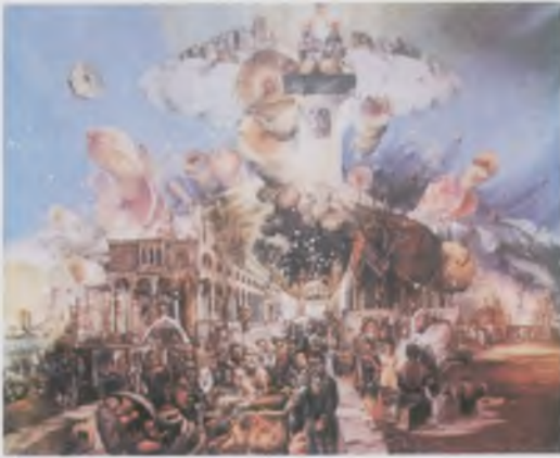
Milić od Mačve