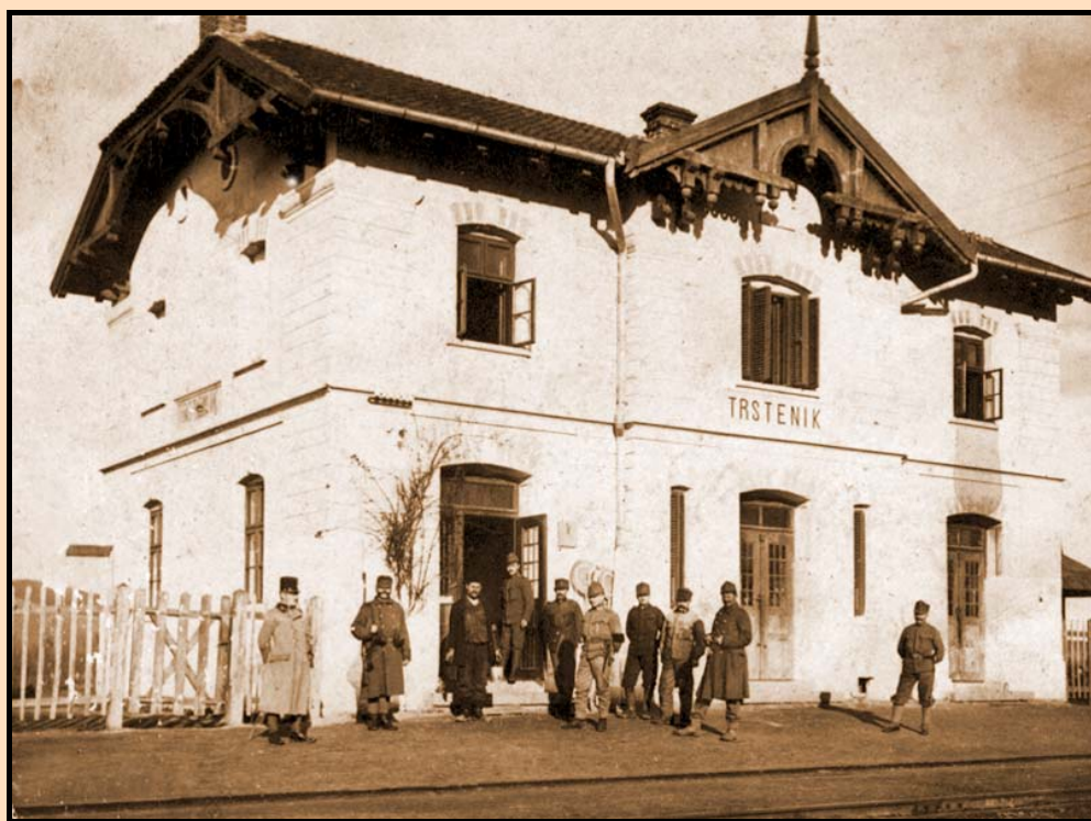
Železnička stanica u Trsteniku sa a. ugarskim vojnicima 1917/18. god.