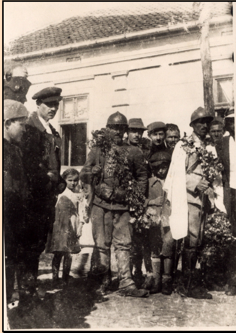
Први српски војници у Трстенику 17. октобра 1918. код Брадићеве куће на раскрсници улица Чајкине и Радоја Крстића.

Сутра дан 17. октобар освануо је миран дан. По вароши још су се виђали а. угарски војници. Али око 10. сахати отпоче пуцњава пушака са свију страна. Комите беху ушле у варош. Већи део непријатељских војника беше пребегао на ону страну Мораве, а неколико њих беху заробљених. Уз комите беху се придружили и неки овдашњи становници такође са пушкама. Пушкарање између комита са ове и а. угарских војника са оне стране Мораве трајало је скоро целог дана. Дрвени мост на Морави аустријанци беху спалили.