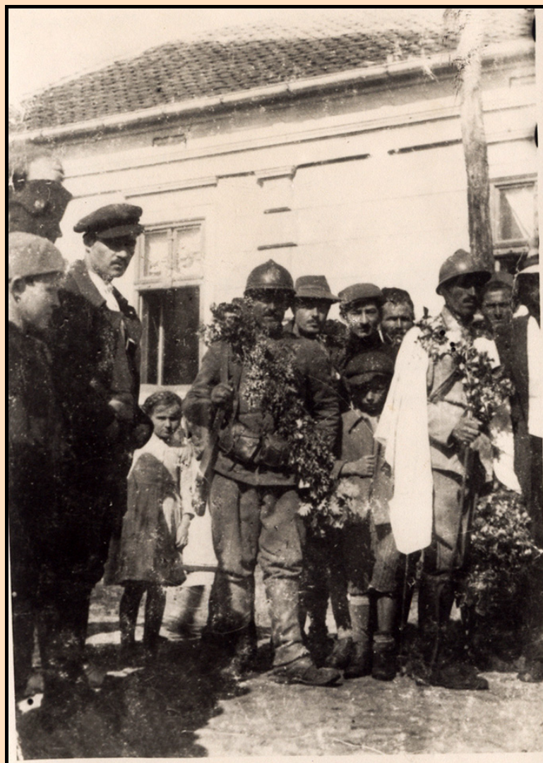
Prvi srpski vojnici u Trsteniku 17. oktobra 1918. kod Bradićeve kuće na raskrsnici ulica Čajkine i Radoja Krstića.

Pred večerje otpočelo je po okrajcima varoši puškaranje između naših komita i a. ugarskih vojnika, ali je bilo retko i trajalo kratko vreme. Oko 9. sahata preko noć ponovilo se.