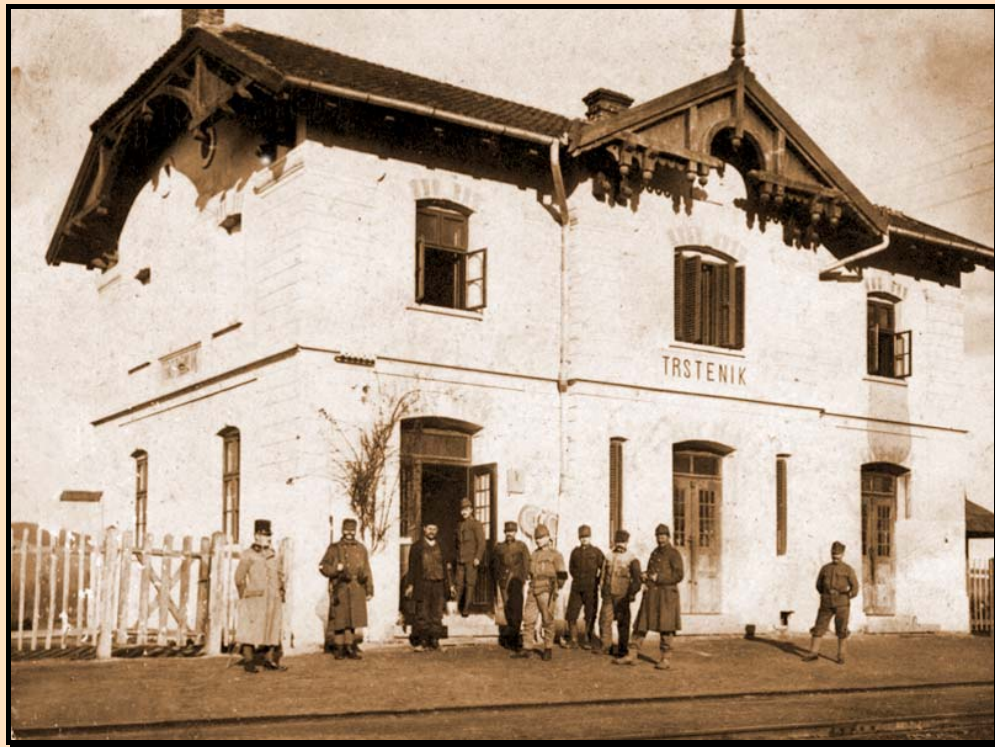
Железничка станица у Трстенику са а. угарским војницима 1917/18. год.

– ( Пеузето из књиге, почев од стране 295. ) –