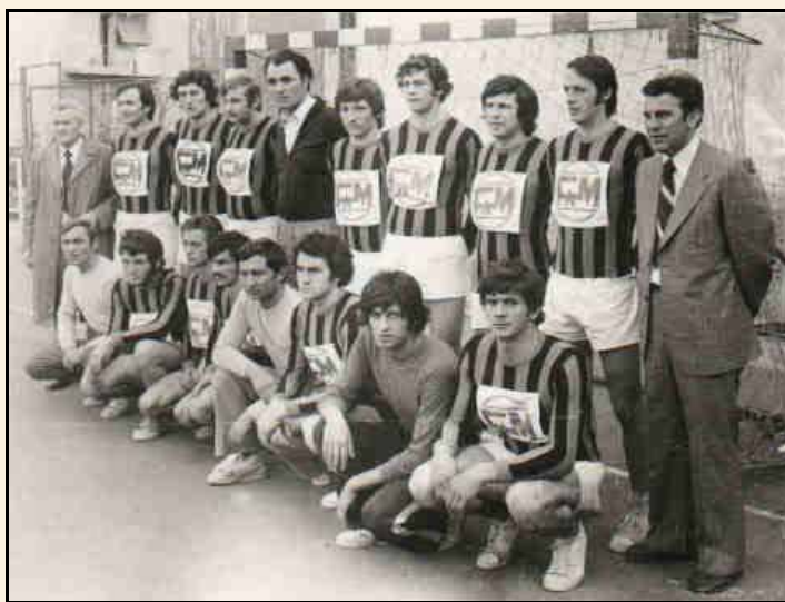
Екипа 1974 - 1979

У лиги у којој смо се затекли када је основано друштво стартујемо као четврти у нади да ћемо у наставку првенства побољшати пласман. Али не иде...