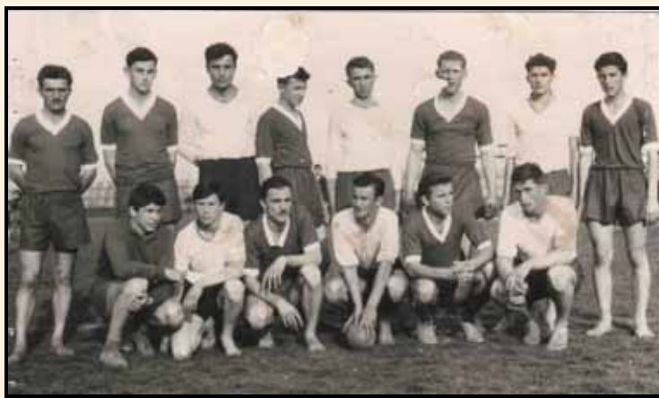
Сл. 1: Прва рукометна екипа у Трстенику

Екипе су наравно биле спремне и сусрет је одржан. Победила је Гимназија резултатом 22:16.