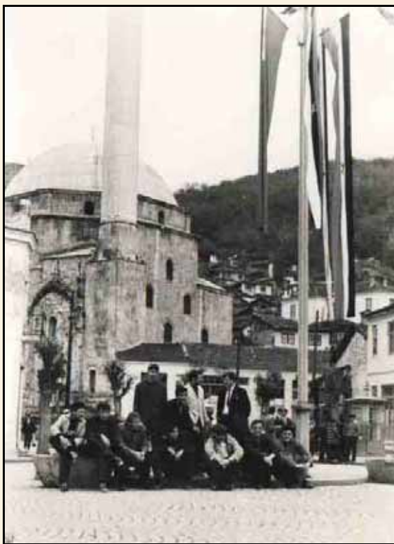
Са једног од многих гостовања на Косову и Метохији

Неки од старијих играча су се покајали што је клубу пошло лоше, њиховом кривицом, враћају се, па је на трстеничком терену дотадашњи првак Влазними из Ђаковице доживео катастрофу. Победа чиста и висока. И у следећем колу доносимо један бод из Приштине, затим још једна победа у Трстенику и екипа се винула високо на табели.