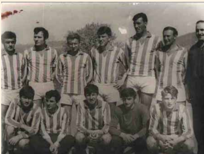
Екипа „Прве Петолетке“ 1968. године

Не успевамо. Остајемо на трећем месту, али пред нама је сезона 1968/1969. И поново смо трећи. Понавља се ситуација из претходне године, у другом делу првенства дочекујемо претенденте за врх на нашем терену. Указује нам се идеална прилика да постанемо прваци.