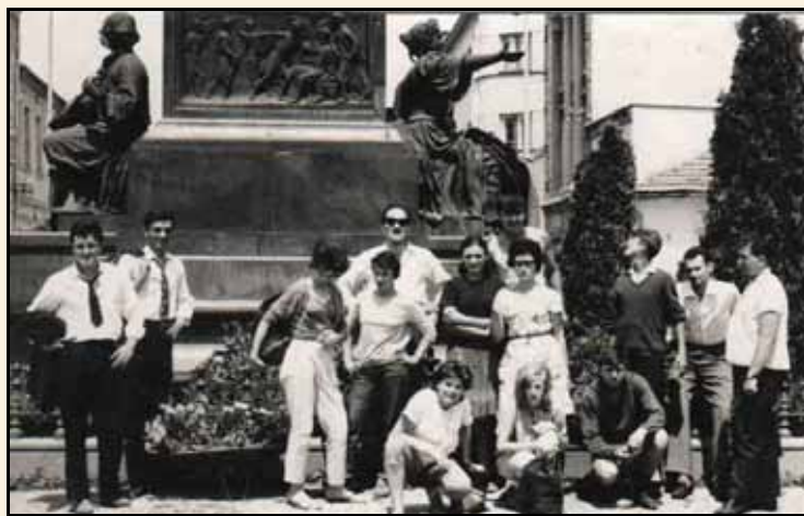
Женска рукометна екипа 1963. године