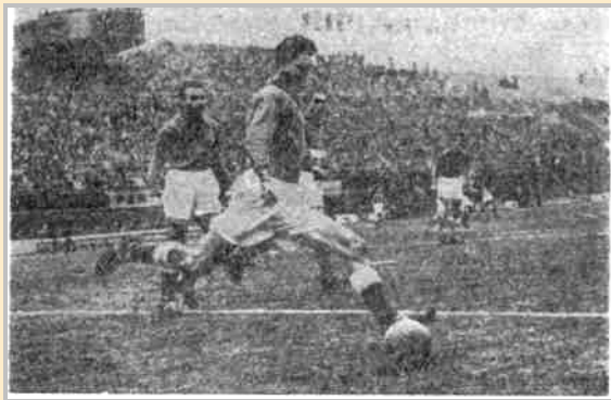
Центар-халф француске репрезентације Хон одбија лопту у поље