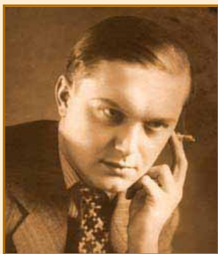
LJ. Vukadinović GVOZDENA PESNICA Pjerov neuspjeh